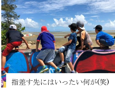
指差す先にはいったい何が(笑)