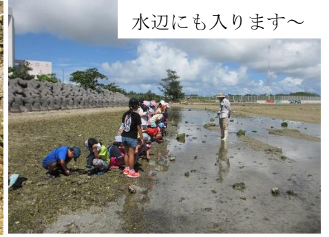
水辺にも入ります～