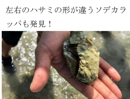
左右のハサミの形が違うソデカラ ツパも発見!