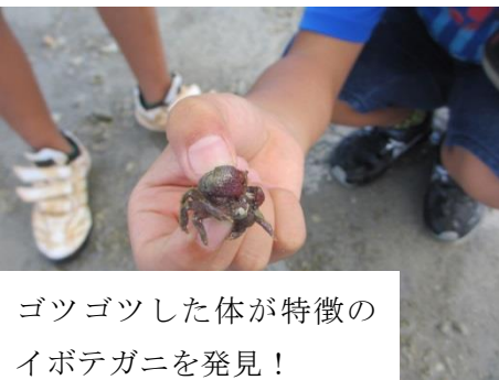
ゴツゴツした体の特徴のイボテガニを発見!