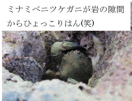
ミナミベニツケガニが岩の隙間からひょっこりはん(笑)