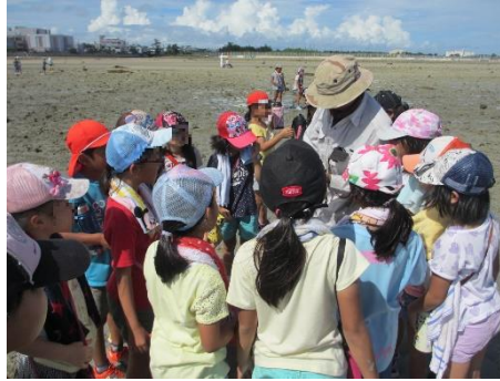
ちっちゃく丸っこくてかわいいね…