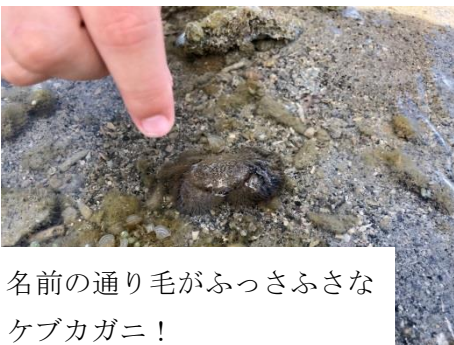
名前の通り毛がふっさふさな ケブカガニ!