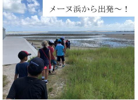
メーヌ浜から出発～!