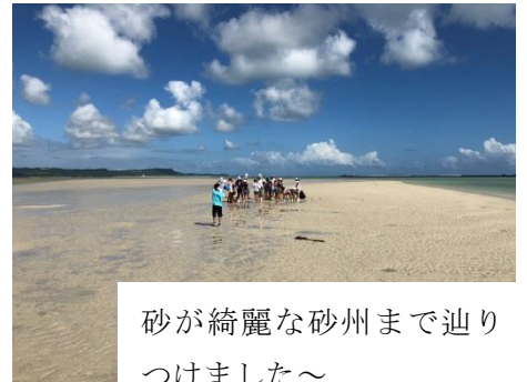
砂が綺麗な砂州まで辿り つけました～