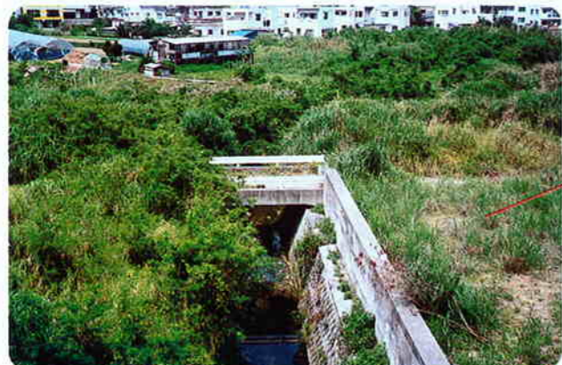
子どもの国付近から見た胡屋、安慶田一带この辺りが比謝川の上流域になる。