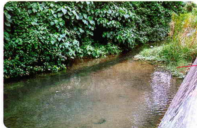
倉敷ダム直下排水口付近の清らかなせせらぎ