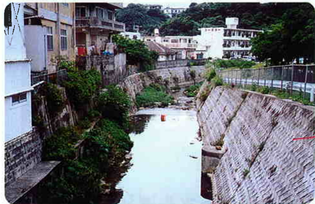
沖縄市農連市場ハンザ橋付近