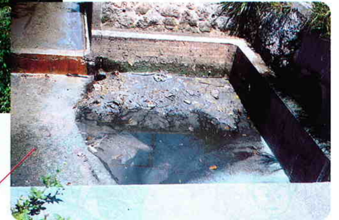
中城湾に流れ込む生活排水