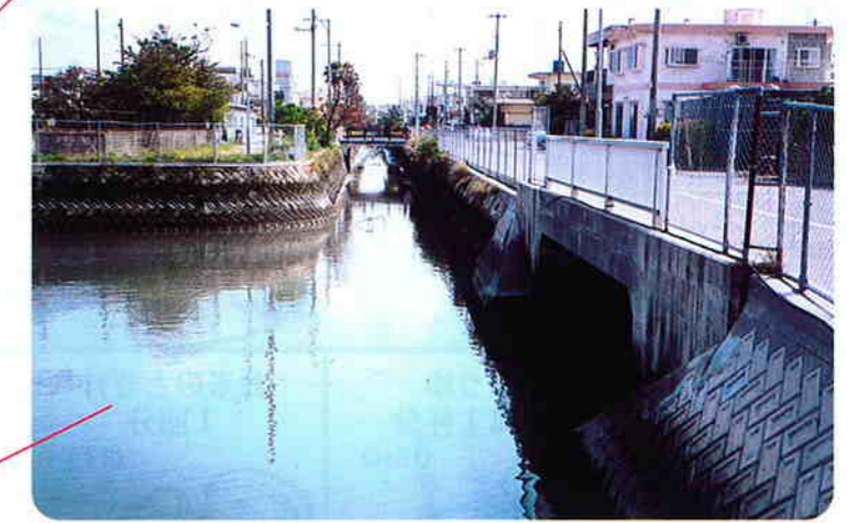
泡瀬3区新泡瀬橋付近の排水路