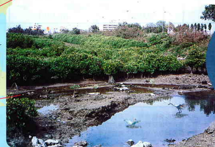
稚ガニの中間育成場のマングロープにたたずむ野鳥