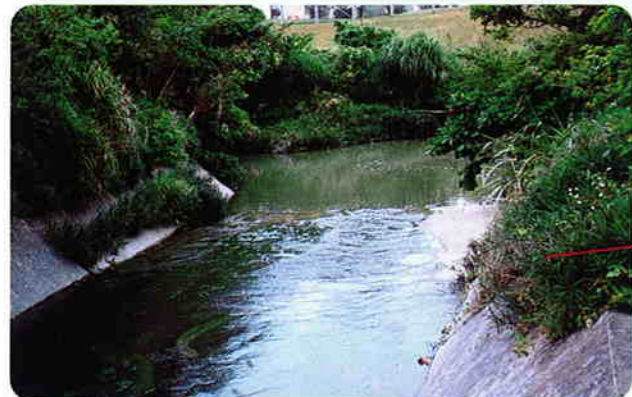
嘉手納空軍基地内の米軍住宅地と比謝川の白川合流地点