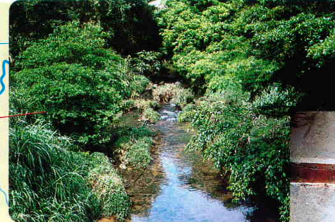
沖縄市と具志川市の境界付近復興橋からみた川崎川