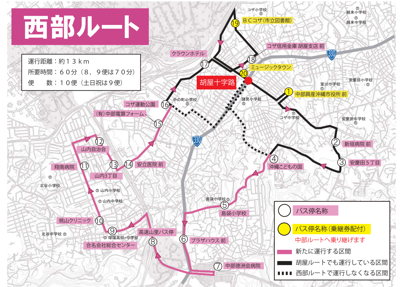
図-1. 西部ルート（現胡屋ルートの見直し）