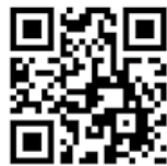
参加施設の PR動画はこちら

お問い合わせ／ 株式会社 琉球新報開発(事業企画部) TEL.098-865-5270