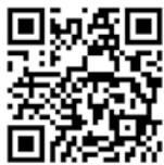
参加施設情報は こちら

*ハローワークの求職活動実績になります。 *3ブースを回って説明を受けた方には、QUOカードをプレゼント