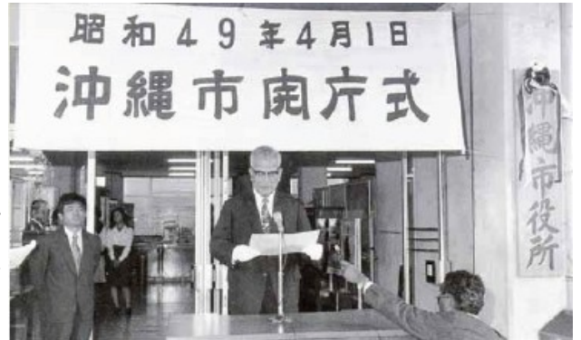
◎KOZA市和美里村合併產生沖繩市(昭和49年4月1日)

四十年前的昭和49年4月1日，在回歸日本後的混亂之中，KOZA市和美里村合併產生沖繩市。這篇特集將介紹以打造「充滿文化氣息和平美好城市」以及以實現「國際文化觀光都市」為目標發展至今的沖繩市的照片以及年代表。（更多的照片與信息請參閱沖繩市報三月號）