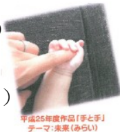
平成25年度作品「手と手」 テーマ:未来(あらい)

【諮詢專線】沖繩市平和・男女共同課 ☎ 929-3147 電郵 a32heiwa@city.okinawa.okinawa.jp