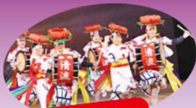
來自盛岡的「三颯舞」