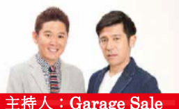
主持人: Garage Sale