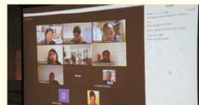
▲熱心に聞く各国の研修参加者

今回の研修は、コロナウイルス感染を考慮し、インターネットを使った遠隔研修を行いました。事前に撮影した講義動画を視聴してもらった後、WEB会議にて質疑応答を行いました。