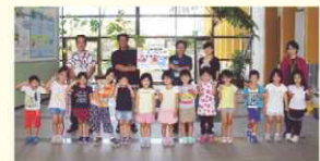
▲松本保育園の園児たちとの一枚

勤労感謝の日に松本保育園の園児から「いつもお仕事のつかれさまで」と激励の言葉をもらい、手作りの切り絵をいただきました。すてきな色づかいで作成されている切り絵は、料金課窓口に飾らせてもらい、職員や来局者の心を和ませています。