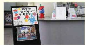
▲料金課窓口に飾っている様子