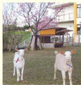
▲草刈りに意欲を見せる2匹