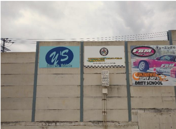
<看板 (小サイズ) >