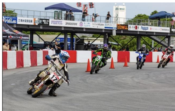
モータースポーツ競技開催時の様子