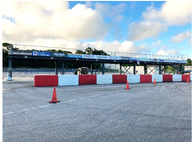
<パドック棟 (フィールド側) >