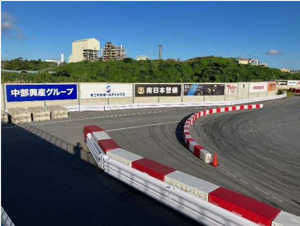
<看板 (大サイズ) >