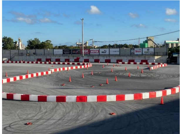
<看板 (中サイズ) >