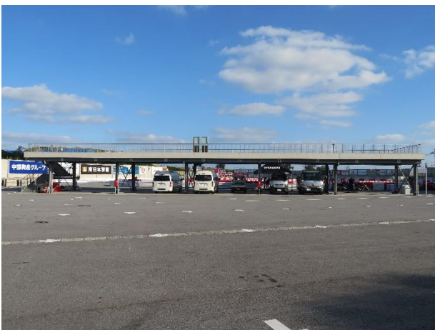
<パドック棟 (駐車場側) > ※新設予定