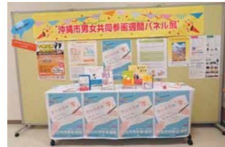
▲ 沖縄市男女共同参画センター 6/24～7/12