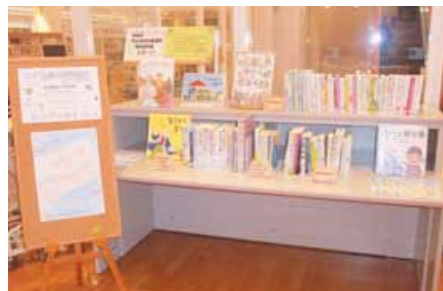
▲ 沖縄市立図書館 6/25～7/7