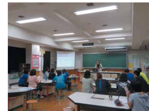
▲ 昨年度の出前講座

沖縄市教育委員会 生涯学習課 098-929-4127 沖縄市男女共同参画センター 098-937-0170