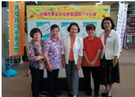
▲ 男女共同参画週間啓発活動