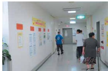
▲ 沖縄リハビリテーションセンター病院 7/1～7/5