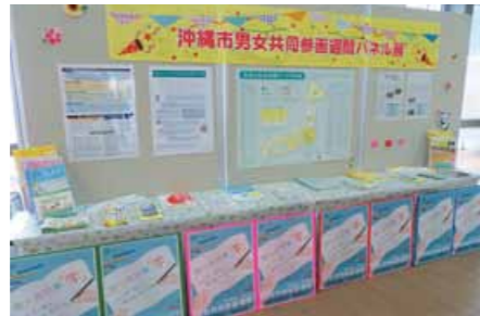
▲ 沖縄市役所1階市民ロビー 6/24～6/28