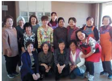
▲「私の自慢料理展と試食会」市役所ロビーにて

また、毎年、「私の自慢料理展と試食会」を市役所のロビーで開催し、会員の方々からの手料理50点余を出品してもらい展示しています。今年は12月24日に開催しますのでどうぞお越し下さい。会員になって私たちと一緒に活動しませんか。