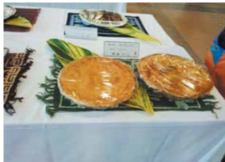
▲ タイモ・アップルパイ