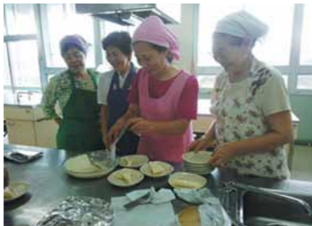
▲ 料理講習(農民研修センター)