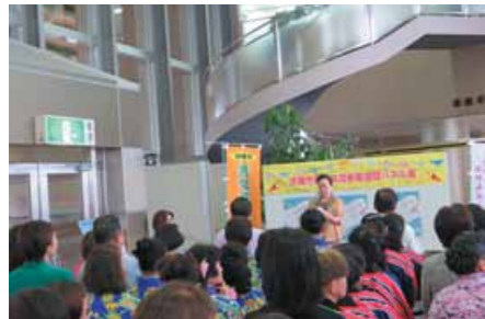
▲ パネル展オープニングセレモニー

男女が、互いにその人権を尊重し、喜びも責任も分かち合い、性別にかかわらず、その個性と能力を十分に発揮できる男女共同参画社会の実現に向け、平成11年6月23日、男女共同参画社会基本法が公布・施行されました。国では、この目的や理念に基づき、国民の理解を深め、男女共同参画社会づくりの促進を図るため、毎年6月23日から29日までを「男女共同参画週間」と定めています。沖縄市では、この期間にあわせて男女共同参画週間パネル展を開催しました。