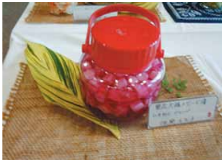
▲ 島野菜を使った漬け物