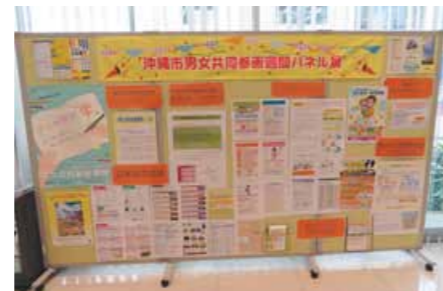
▲ コザ信用金庫本店 営業部 7/8～7/12