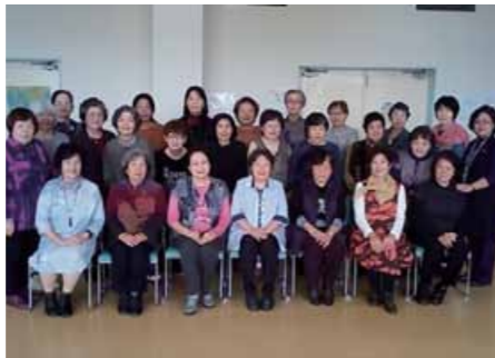
▲ 沖縄市農漁村生活研究会新年会