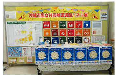
▲ 沖縄市男女共同参画センター