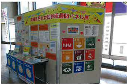
▲ 沖縄市役所市民ホール

沖縄市では6月22日から26日までの間、男女共同参画に関するパネル展を市役所市民ホール、沖縄市立図書館（関連図書紹介 6/26～7/5）、沖縄市男女共同参画センターにて開催しました。今回は新型コロナウイルス感染症拡大防止のため、例年より縮小しての開催となりましたが、理念について普及・啓発を図るほか、市の現状や取組状況等についての情報を提供しました。