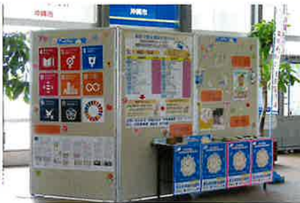
▲ 沖縄市役所市民ホール