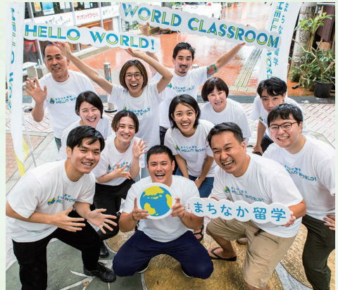
▲手前の左から2番目

沖縄市一番街商店街には、HelloWorld株式会社のような熱い起業家が集まり、盛り上がりを見せています。人が人を呼び連鎖することで面白い化学反応が起こるまちコザ。これは一度コザに来ざるを得ない!!