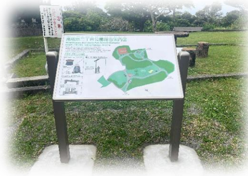
防災関連公園施設：総合案内図