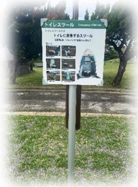
防災関連公園施設：トイレ兼ベンチ利用サイン