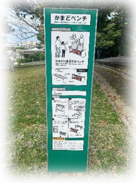
防災関連公園施設：かまどベンチ利用サイン