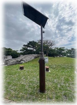
防災関連公園施設：非常用照明灯 ※コンセント1口、USB4口付き