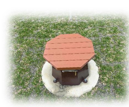
防災関連公園施設：トイレ兼ベンチ