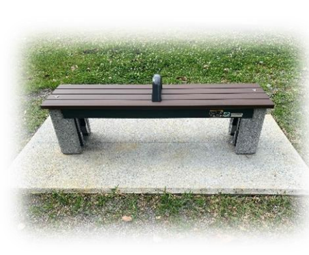
防災関連公園施設：かまどベンチ