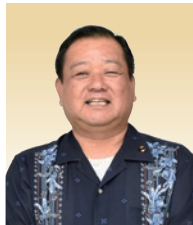
あたり おさむ 阿多利 修