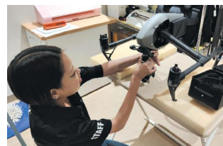
▲ドローンの整備をする絵季加さん