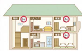
住宅用火災警報器を設置しましょう! 煙や熱を感知して、警報音や音声で火災発生を知らせます。

建物火災の死者に占める住宅火災の死者の割合は88%となっています。 住宅火災の早期発見には、住宅用火災警報器の設置が有効です。設置場所は、就寝中の逃げ遅れを防ぐため、寝室及び1階を除く寝室がある階の階段となっています。