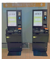
▲キャッシュレス券売機