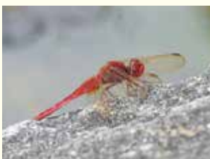
タイリクショウジョウトンボ

もう一種、台風が来るようになると見る機会が増えるウスバキトンボも赤みを帯びるトンボです。沖繩では「カジフチダーマ」とよばれて、よく特徴をあらわしています。寒さが苦手な、沖繩本島の冬を越えることができません。毎年、もつと南で年を越したトンボが風につられてやってきて、沖繩で繁殖し、あちこちへ飛んでいきます。 他にも、濃いピンクのベニトンボや、ひとまわり大きいハネビロトンボなど、赤とんぼは何種かいますが、どれも秋だけにみられる虫ではありません。沖繩の赤とんぼは、ほとんど年がら年中いるのです。 (文書 刀欄)