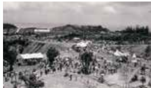
▲沖縄こどもの国誕生(1970年)にする施設として開園しました。