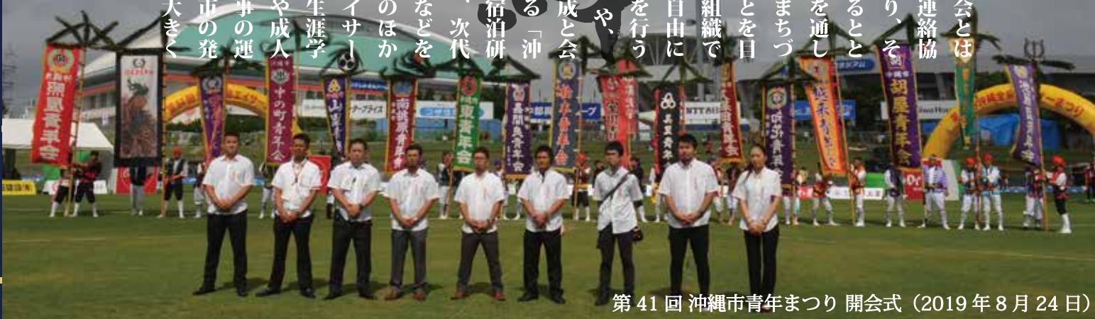
第41回 沖縄市青年まつり 開会式 (2019年8月24日)

沖縄市青年団協議会とは、各自自治会青年会の連絡・調整や親睦交流を図り、その助長発展に努めるとともに、様々な活動を通して、地域の発展とまちづくりに貢献することを目的に活動している組織です。本市の青年が自由に意見や情報の交換を行う「青年フォーラム」や、地域のリーダー育成と会員の資質向上を図る「沖縄市青年リーダー宿泊研修会」等を開催し、次代を担う人材の育成などを行っています。そのほかにも、沖縄全島エイサーまつりをはじめ、生涯学習フェスティバルや成人式典など、各種行事の運営等に携わり、本市の発展とまちづくりに大きく貢献しています。