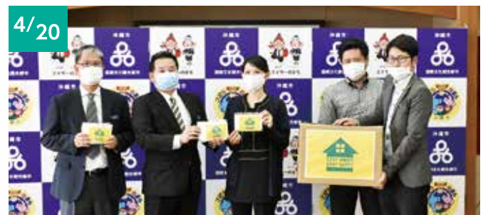
4/20 株式会社ホワイトオレッドサイド (代表取締役 新里 夢子) 他 マスク 1,000枚 [市内小中学校へ]