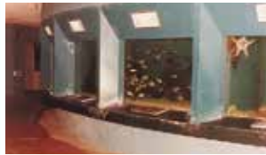
▲水族館も完成し、充実したテーマパークへ