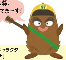
沖縄市平和イメージキャラクター ソテツの妖精「キューナ」