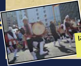
はいさいFESTA2018 神奈川県川崎市 照屋青年会

エイサー派遣とは別に日本各地で行われている沖縄関連の祭りへ沖縄市の物産やエイサーを派遣し沖縄市のPR活動を行っています！青年会はエイサーだけではなく、PR用チラシの配布や、会場で衣装の着付け体験なども行っています！