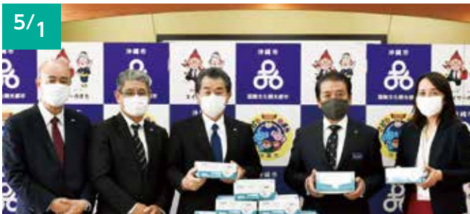
5/1 中部興産株式会社 (代表取締役社長 新垣 博孝) マスク 10,000枚 [市内障がい者福祉施設へ]