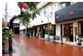
パルミラ通りの一番街寄りにあります