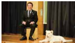
▲ホワイライオンが九州・沖縄で初展示(2017年)