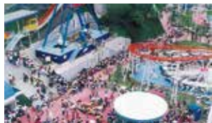
▲遊園地「沖縄アイランドパーク」がオープン(1990年)