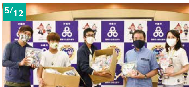
株式会社たなごころ(代表取締役 岸 裕機) マスク 5,000枚 [自治会へ]