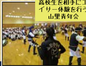
高校生を相手にエイサー体験を行う 山里青年会

沖縄県に修学旅行に来た学生に対して、宿泊ホテルなどに直接伺い、青年会によるエイサーの披露・体験を行って、沖縄の伝統文化の体験と、沖縄市のPRを行っています。