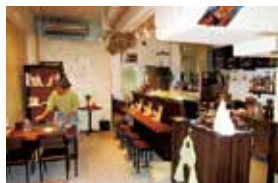
白を基調にした落ち着いた雰囲気の店内