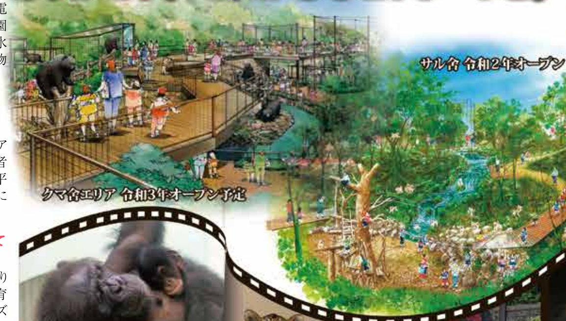
クマ舎エリア 令和3年オープン予定