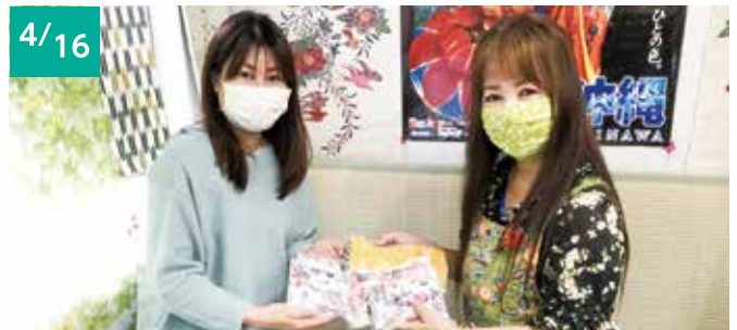
4/16 さくら琉舞衣裳店 (代表 高江洲 繁美) 布製マスク 50枚 [児童養護施設 美さと児童園へ]