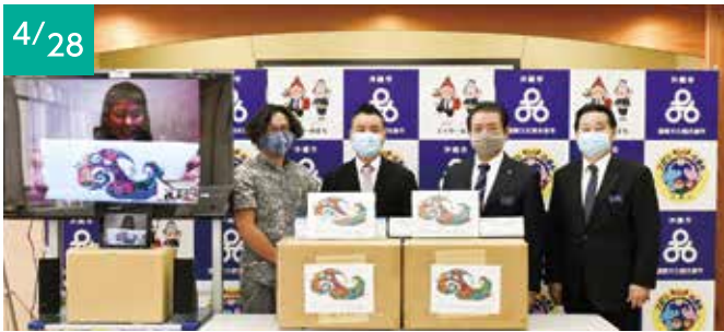
4/28 『沖縄アマビエプロジェクト』 株式会社アルバトロス (代表取締役社長 羅 哲峻) マスク 10,000枚 [市内小中学校・市内介護事業所へ]