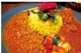
ポークキーマと骨付きチキンのカレー

第2回目は、パルミラ通りにある通りの名にちなんだ本格カレーのお店「スパイスカレーパルミラ」をご紹介します! 店主おすすめの「カレー2種盛り」は、数種類からお好きな組み合わせで楽しめ、1種のみならお持ち帰りもできます。 「骨付きチキンカレー」のチキンは、スプーンで簡単に骨から肉を剥せるほど柔らか。野菜のみを使った「ヴィーガンカレー」もおすすです。