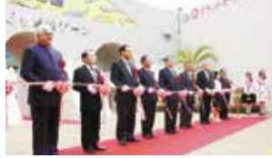
▲リニューアルオープン!(2004年)