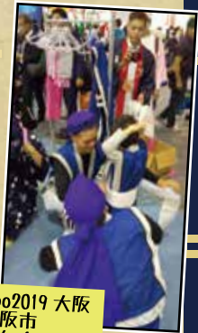
ツーリズム Expo2019 大阪 大阪府大阪市 南桃原青年会