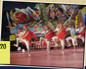
ふるさと祭り東京 2020 東京都文京区 園田青年会