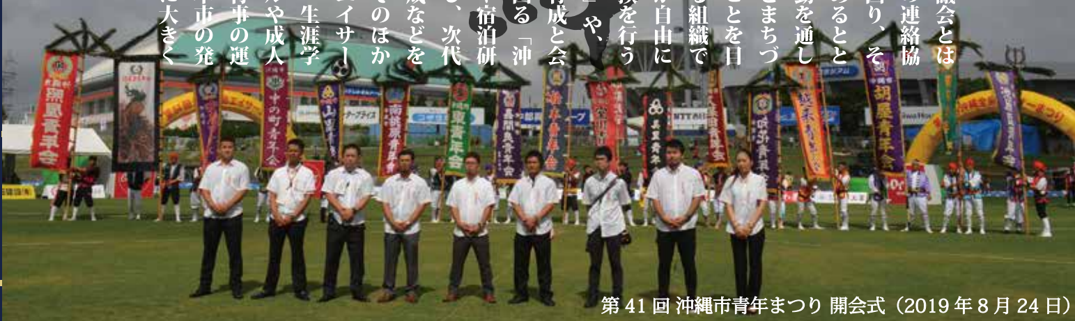
第41回 沖縄市青年まつり 開会式 (2019年8月24日)

沖縄市青年団協議会とは、各自自治会青年会の連絡・調整や親睦交流を図り、その助長発展に努めるとともに、様々な活動を通して、地域の発展とまちづくりに貢献することを目的に活動している組織です。本市の青年が自由に意見や情報の交換を行う「青年フォーラム」や、地域のリーダー育成と会員の資質向上を図る「沖縄市青年リーダー宿泊研修会」等を開催し、次代を担う人材の育成などを行っています。そのほかにも、沖縄全島エイサーまつりをはじめ、生涯学習フェスティバルや成人式典など、各種行事の運営等に携わり、本市の発展とまちづくりに大きく貢献しています。