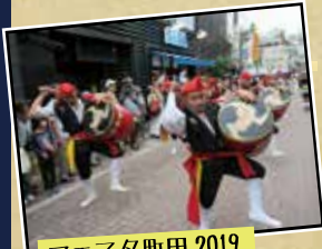
フェスタ町田 2019 東京都町田市 諸見里青年会

今や日本全国で行われている様々なエイサー祭りから要望があったところへ沖縄市青年団協議会が市内の青年会を派遣し本場のエイサーを披露しています！