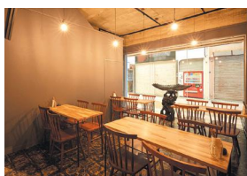
落ち着いたテーブル席