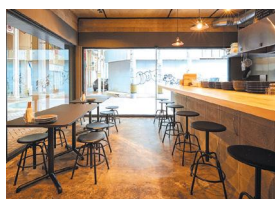
開放感のあるカウンター席