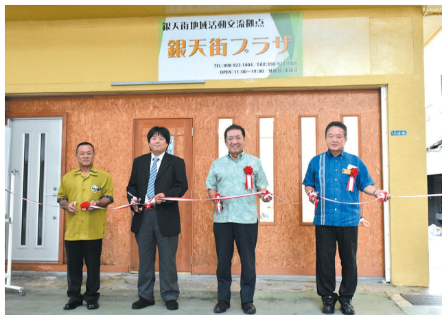
銀天街地域活動交流拠点「銀天街プラザ」 住所:照屋1-11-10 1階 TEL:098-923-1404

銀天街内に設置された『銀天街プラザ』は、銀天街地域の活性化と空き店舗対策等の地域課題の解決、こどもや高齢者の居場所づくり、ナイトマーケットイベントなど、さまざまな取り組みが期待されています。