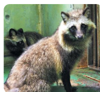
ホンダタヌキ「おわり」