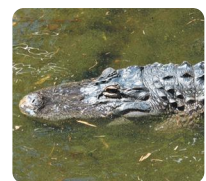
ミシシッピアリゲーター 「ワニオ」