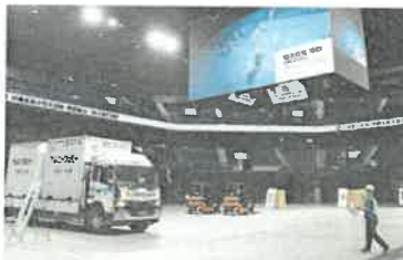
大規模地震などを想定し実施された県の物資輸送・拠点運営訓練＝20日、沖縄市の沖縄アリーナ