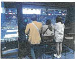
VRルームを活用したセンサリールームで試合観戦を楽しむ当事者一家＝沖縄市の沖縄アリーナ