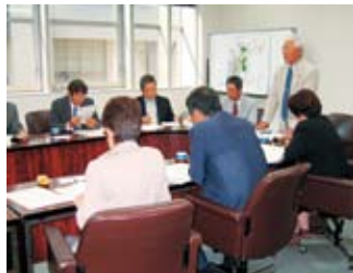
▲委員を代表して挨拶をする委員長