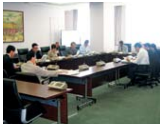
▲説明を受ける委員