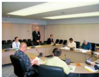
▲事務局次長より歓迎の挨拶をいただく