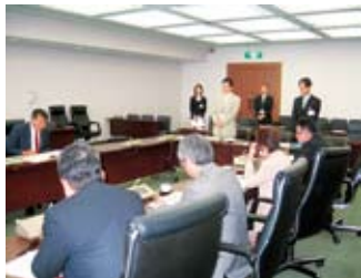
▲大牟田市議会事務局より歓迎のあいさつをいただく