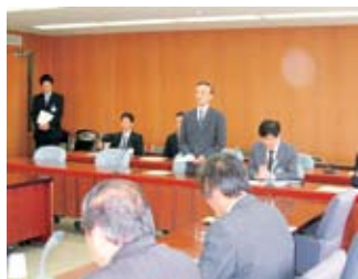
▲副議長より歓迎の挨拶をいただく