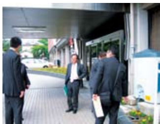
▲市庁舎前に設置された簡易貯留槽