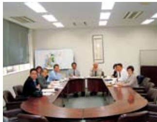
▲説明を受ける委員