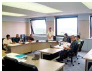
▲委員を代表して挨拶をする委員長