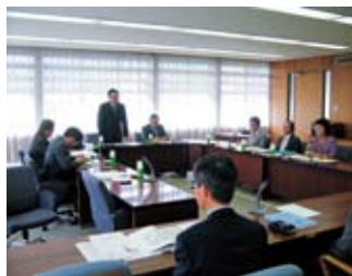
▲委員を代表して挨拶をする委員長