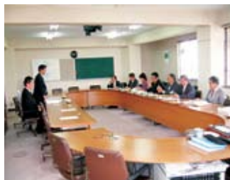
▲説明を受ける委員