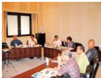
▲説明を受ける委員