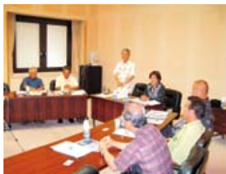
▲委員を代表して挨拶をする委員長