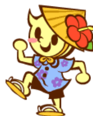
沖縄市健康づくりキャラクター おきはくん

日時：令和3年11月11日（木）14時～16時 場所：市立図書館（まなびの部屋 ①）