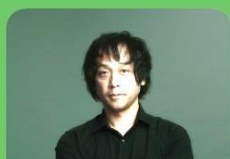
神山 繁氏 (映画プロデューサー)