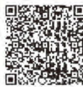
新型コロナウイルス感染症に係る保険料減免

また、新型コロナウイルス感染症の影響により被保険者・世帯主の失業、疾病等により所得が減少している方の、保険料の減免申請期限は、 令和5年3月31日(金) です。期限内に申請してください。