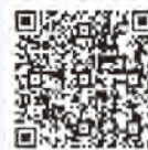
新型コロナウイルス感染症に係る保険料減免

世帯の生計を主に維持している方が死亡、重篤な傷病を負った場合または30%以上の収入減少が見込まれる場合