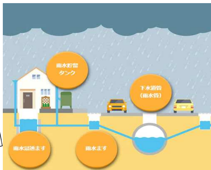
雨水貯留・浸透施設図 (日本下水道協会 HP より)