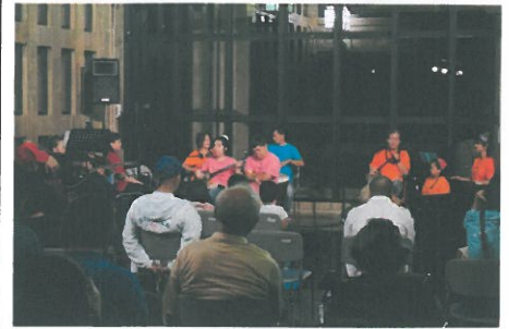
☆ロビーコンサート