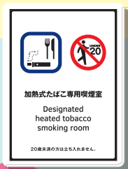
加熱式たばこ 専用喫煙室