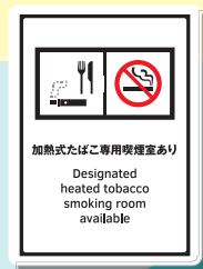
加熱式たばこ 専用喫煙室あり